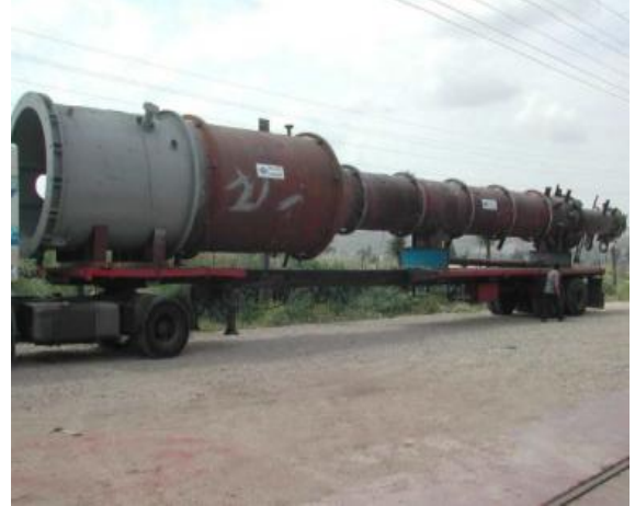
COLUMNA CEPSA - REFINERIA HUELVA