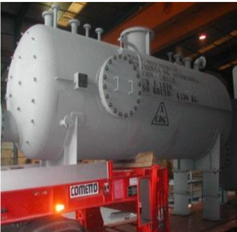
DEPOSITO ENAP REFINERIAS - CHILE