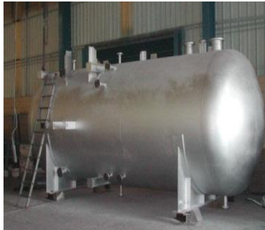
DEPOSITO - ENERCON CHILE

COMUNICAMOS A NUESTROS CLIENTES QUE ESTOS SON ALGUNOS DE LOS MUCHOS TRABAJOS EN LA CUAL NOSOTROS HEMOS TRABAJADO (VER MAS REFERENCIAS EN ANEXOS)