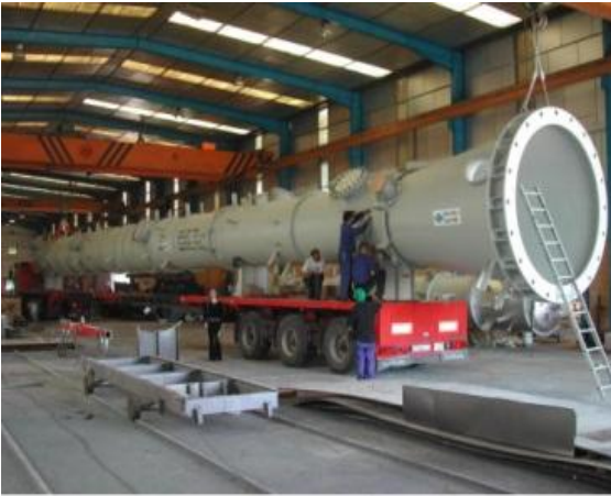
COLUMNA PETROX - REFINERIA TALCAHUANO CHILE